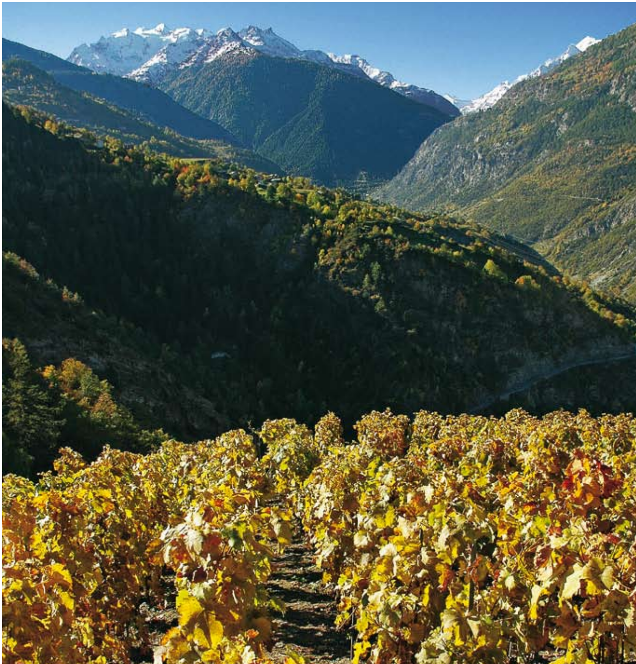
Der Reberg «Rieben» ist den Gletschern nahe. Blick auf Balfrin (l.) und dahinter einen Teil der Mischabel sowie (r.) Brunegg- und Weisshorn