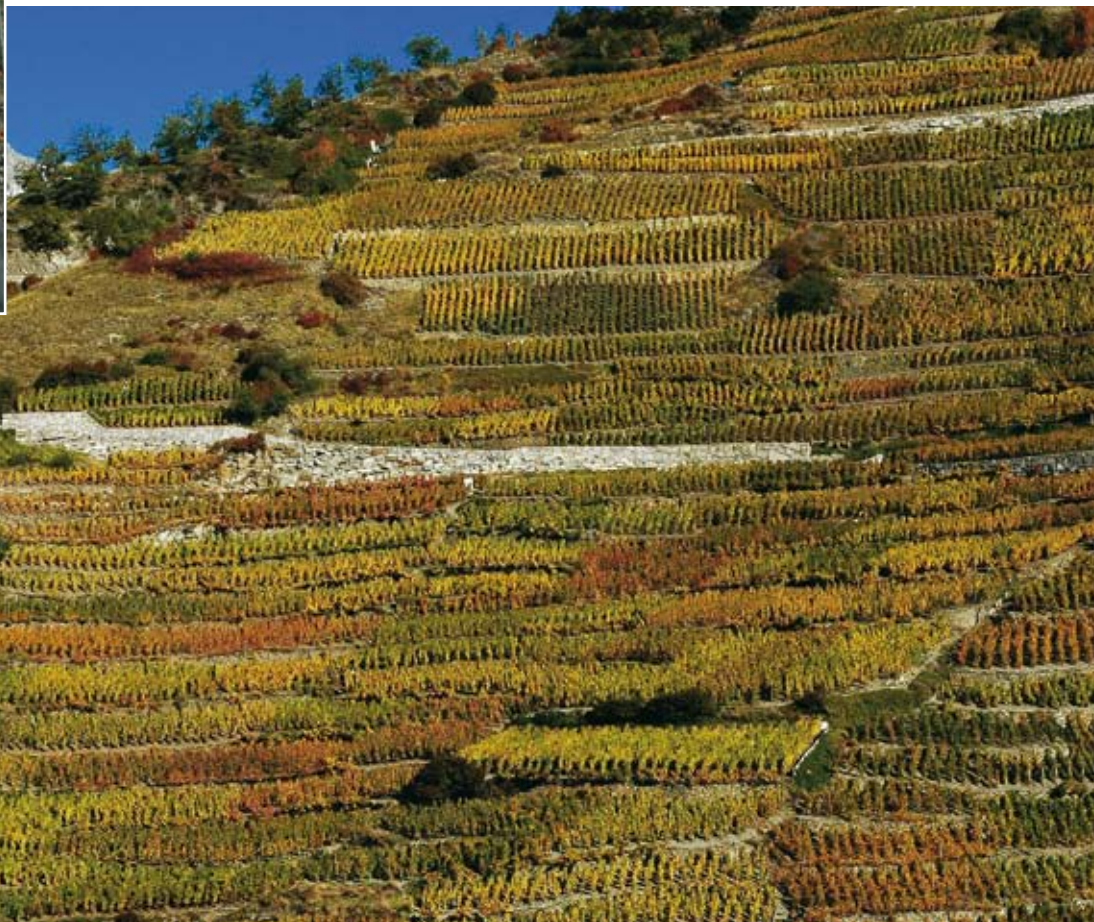
Blick über den höchstgelegenen Rebberg Europas, die «Rieben»

Natürlich war es schwierig, mit dem durch Erbteilungen stark parzellierten Betrieb zu überleben. Die kleinen Felder, Weiden und Weinberge liegen oft kilometerweit auseinander und sind an steilen Lagen zu finden. Dies bedingte eine Art Halbnomadentum: Je nach Arbeit