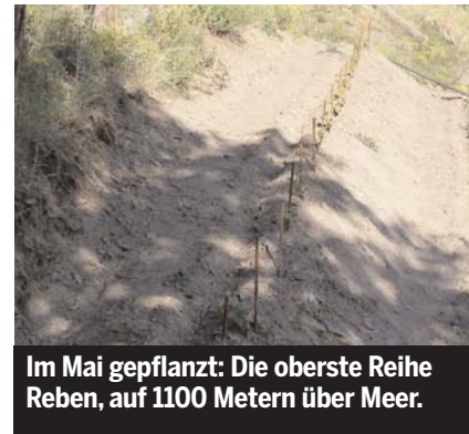
Im Mai gepflanzt: Die oberste Reihe Reben, auf 1100 Metern über Meer.