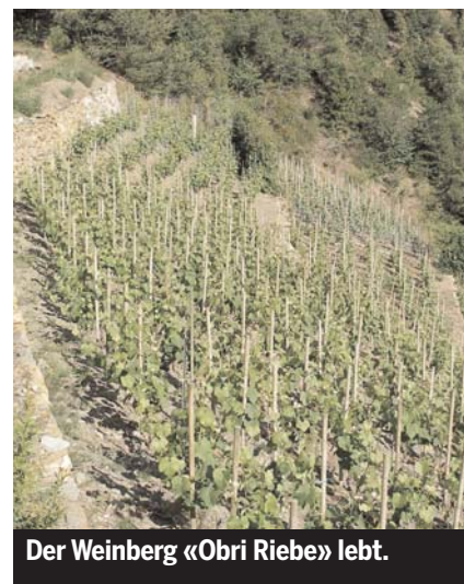
Der Weinberg «Obri Riebe» lebt.