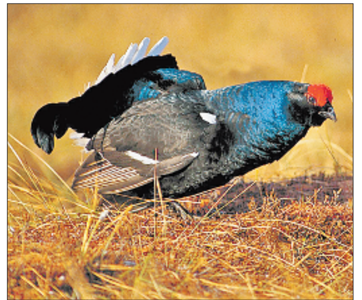
In der Schweiz leben noch rund 15 000 bis 20 000 Birkhühner.

Die Studie der Universität Bern und der Vogelwarte Sempach wurde vom Schweizerischen Nationalfonds finanziert. Die Ergebnisse wurden in der aktuellen Ausgabe der Fachzeitschrift «Journal of Applied Ecology» publiziert. Weitere Untersuchungen sind geplant. So soll laut Arlettaz nun der Einfluss von Schneeschuhwanderern und Variantenskiliftern auf das Birkhuhn in Lebensräumen weitab von Skigebieten erforscht werden. Birkhühner leben im Übergangsbereich von Wald zu Alpweiden, in einer Höhe von 1800 bis 2000 Metern über Meer. Laut Marti wird ihre Zahl in der Schweiz auf ungefähr 15 000 bis 20 000 Tiere geschätzt.