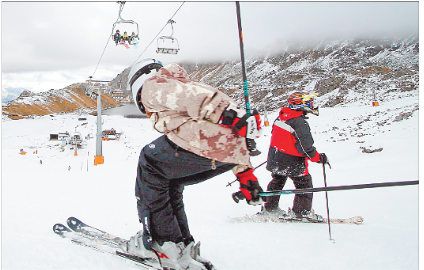
«Je mehr Skilifte, desto weniger Birkhühner»: In Skigebieten sind die Bestände um 49 Prozent kleiner als in vergleichbaren Gebieten ohne Skilifte.