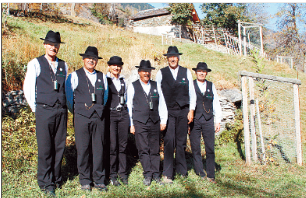
Der Heida-Zunft vor dem «Cheschtene»-Begegnungszentrum in Mörel.