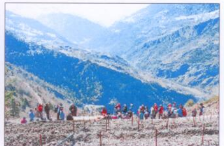
Blick auf die Bergwelt von der höchsten Rebparzelle Europas.