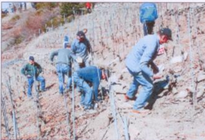
Rebwerk ist harte Arbeit.