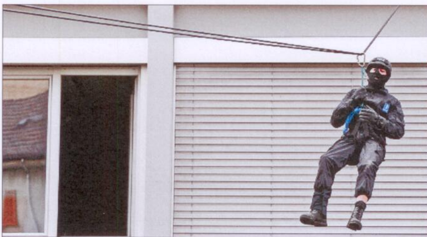
«Tigris» (Archivbild: Übung im Jahr 2007) gibt zu reden: Wussten alle Kantone von der Existenz dieser Sondertruppe?