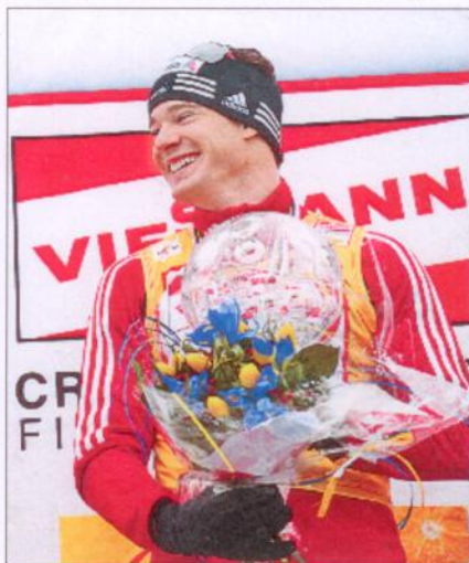
Cologna: «Ich fürchte niemanden.»

Dieses Husarenstück ist bis heute nämlich noch keinem Schweizer oder keiner Schweizerin gelungen. Zuletzt schaffte Andy Grünenfelder im Jahr 1983/1984 den siebten Gesamtrang, ein Jahr später wurden Giachem Guidon Achter und Evi Kratzer sogar Fünfte. Der Sieg Colognas aber stellt alles Bisherige in den Schatten. «Ich fürchte niemanden», sagte der Schweizer Sensationssieger über seine Gegner. Den Grundstein hat der Bündner nebst den Erfolgen an der Tour de Ski am Samstag bei der 20-km-Verfolgung gelegt. «Das war wahrscheinlich mein bestes Rennen überhaupt», sagte der grosse Dario. Seite 13