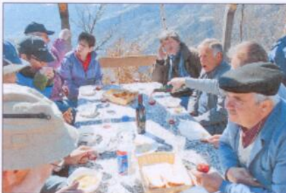
Gehört zum Rebwerk: Pflege der Geselligkeit.