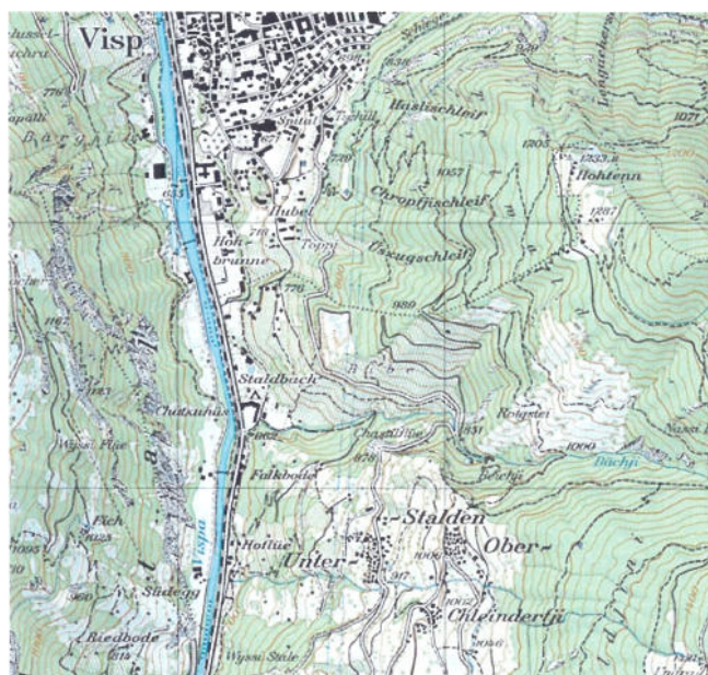
Landeskarte 1:25'000 Swisstopo, Blatt 1288

Der höchste Rebberg Europas, «Rieben» genannt, liegt in Visperterminen oberhalb von Visp und erstreckt sich von 660 bis auf 1150 m ü. Meer. Der Rebberg, der schon von C. F. Ramuz beschrieben wurde, ist durch zahlreiche Terrassen mit hohen Trockensteinmauern strukturiert. Die Trockenmauern formen aus den Steilhängen kleine Rebärten, welche oft nicht grösser als ein Quadratmeter sind. Dank der Südlage in der trockensten Gegend der Schweiz ist der Hang klimatisch begünstigt. Die grossen Steinflächen des Mauerwerks und der Föhn spenden den «Rieben» bis in den Spätherbst Wärme. Um zu überleben, führten die Bewohner von Visperterminen in der Vergangenheit ein Nomadenleben und folgten der Arbeit. Davon zeugen die dreizehn über den ganzen Berg verteilten Weiler ( www.heida-zunft.ch ).