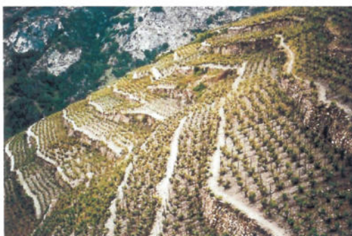
Abbildung 14: Grössere Terrassenflur oberhalb von Visperterminen (Typ II)

Die Mitglieder wiederum sind verpflichtet, ein- oder mehrmals jährlich bei der Rebstockpflege mitzuhelfen, welche auf allen Parzellen der Heida-Zunft durchgeführt wird (die Parzelle mit den 209 Mitglieder-Rebstöcken ist nur eine von mehreren). Als Lohn für die Arbeit an den Rebwerken erhält ein Mitglied jedes Jahr eine Flasche Heida. Aktuell besitzt die Heida-Zunft 1357 Quadratmeter Rebfläche, welche mit 625 Rebstöcken bestockt ist. Zusätzlich hat sie 98 Quadratmeter Rebfläche gemietet, welche mit 112 Rebstöcken bepflanzt ist.